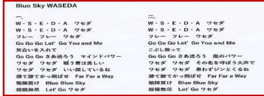
応援歌 「Blue Sky WASEDA」