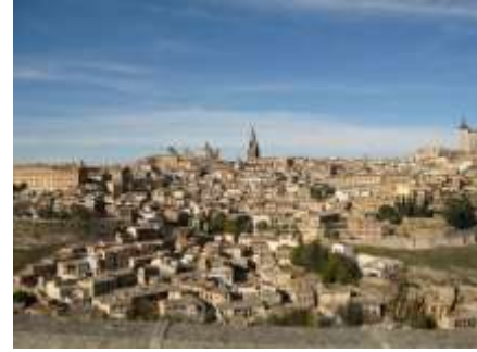
宇都木光一 「トレド街並み」