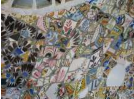
宇都木光一 「グエル公園・ガウディのモザイクタイル」