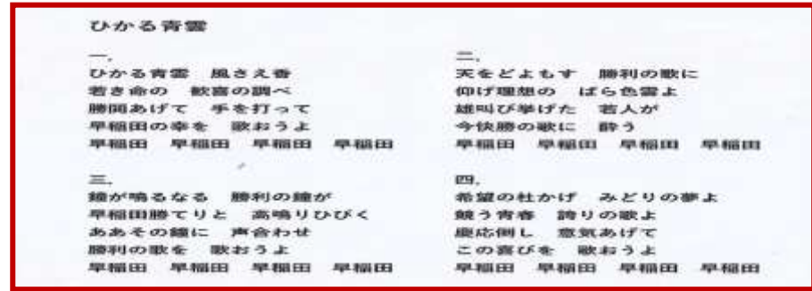
応援歌 「ひかる青雲」