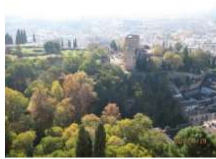
宇都木光一 「アルバイジンの丘からアルハンブラ宮殿」