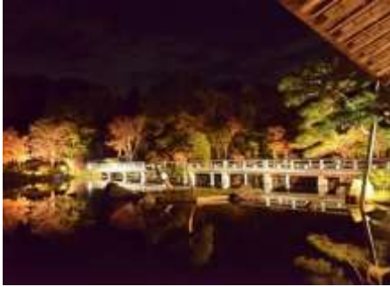
石川清次 「橋のライトアップ」 昭和記念公園