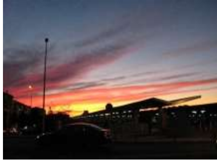
宇都木光一 「コルトバの夕景」