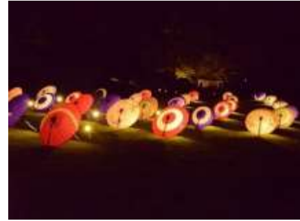
石川清次 「和傘が並んだ」 昭和記念公園