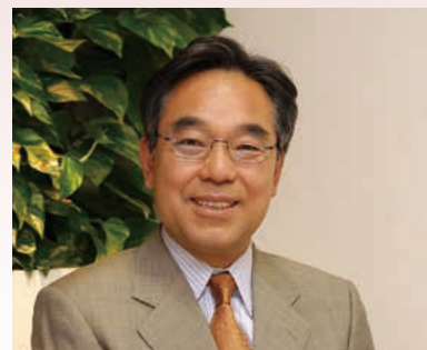
三宅 民夫 (NHKアナウンサー)