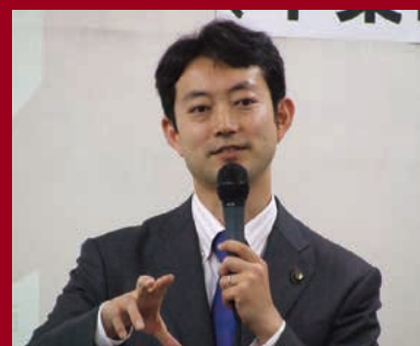
熊谷 俊人 (千葉市長)