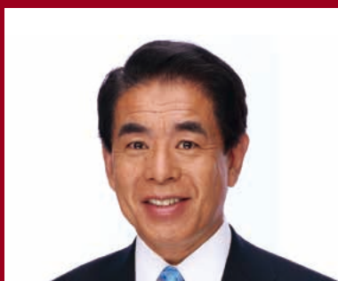
下村 博文 (文部科学大臣)