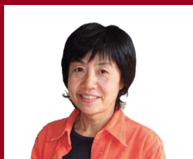
熊谷 博子 (映像ジャーナリスト)